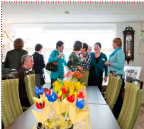
In Valkenswaard realiseerde Woonbedrijf samen met Stichting Valkenhof 'De Pilaar', een warm steunpunt met allerlei faciliteiten voor senioren.