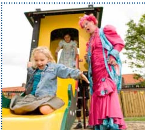
Straat aan zet in Tivoli (Stratum): bewoners kiezen zelf voor een speel- en ontmoetingsveld als invulling van een terrein.