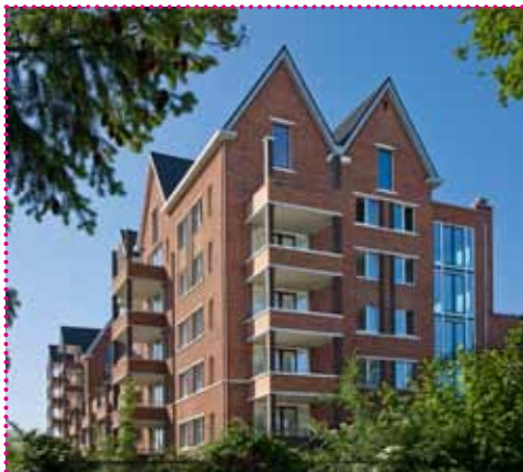
Woonbedrijf realiseert 43 huurappartementen en 22 woningen met een fraaie architectonische detaillering in overBurght, in het centrum van Geldrop .