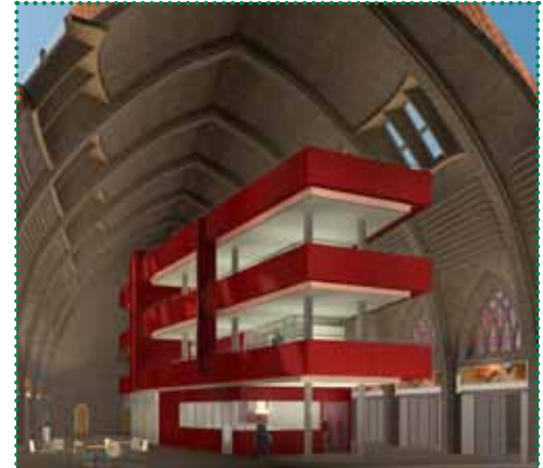
Woonbedrijf herontwikkelt de Pastoor van Arskerk in wijk De Barrier (Woensel) tot een multifunctionele ruimte voor de buurt.