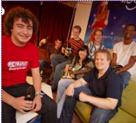
Als beheerder van ruim 2.700 studentenkamers , sponsoren wij StukaFest, een uniek evenement met live entertainment op studentenkamers door de hele stad.