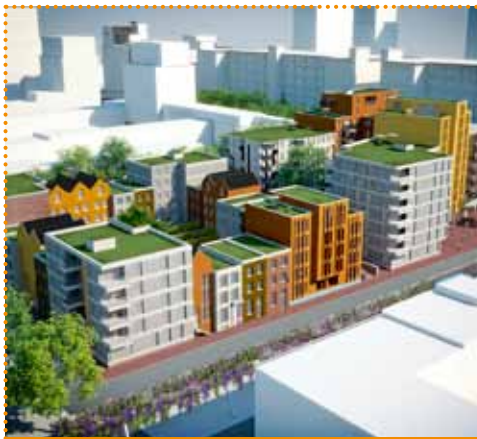
Woonbedrijf bouwt als eerste op Strijp-S : 178 appartementen met balkon/loggia en 20 stadswoningen met tuin. Mix van huur en koop in het creatieve hart van Eindhoven.