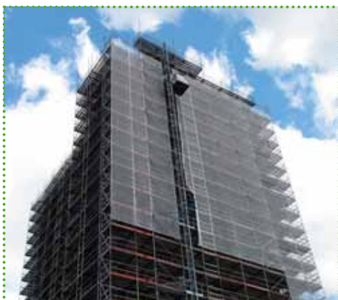
Grootschalige renovatie wooncomplex aan de Echternachlaan in Woensel met bijzondere aandacht voor isolatie, veiligheid en herstel van architectonische elementen.