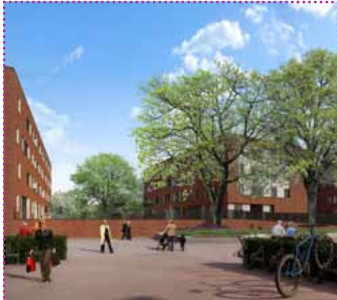
Het Podium: 83 huurappartementen voor senioren (55+) in Doornakkers (Tongelre) waarbij de binnentuin drie woonblokken verbindt en ontmoeting stimuleert.