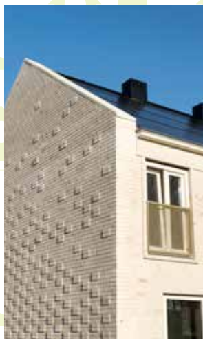
GEÏNTEGREERDE ZONNEPANELEN IN DE AIREYWIJK