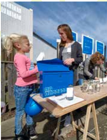
STROOMPUNT: BEWUST OMGAAN MET WATER IN EN OM DE WONING EN WIJK

Een duurzame toekomst is de verantwoordelijkheid van iedereen. Ook van Woonbedrijf. Wij gaan onze verantwoordelijkheid niet uit de weg. Integendeel: we omarmen de duurzaamheidsgedachte en verankeren duurzaam denken en doen in ons dagelijkse werk. En in de keuzes die we als organisatie maken op het gebied van nieuwbouw en renovatie. Dat duurzaamheid een integraal onderdeel van ons werk moet zijn, staat ook in ons koersplan. De weg die we in 2012 onderzoekend zijn ingeslagen, volgen we nu vol overtuiging. We inspireren elkaar en leren van elkaar. Ons motto: gewoon de goede dingen doen!