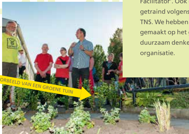
VOORBEELD VAN EEN GROENE TUIN